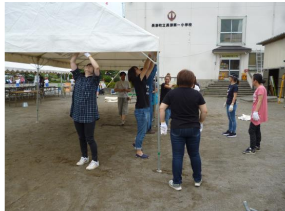
【PTA運動会前日準備・片付け】