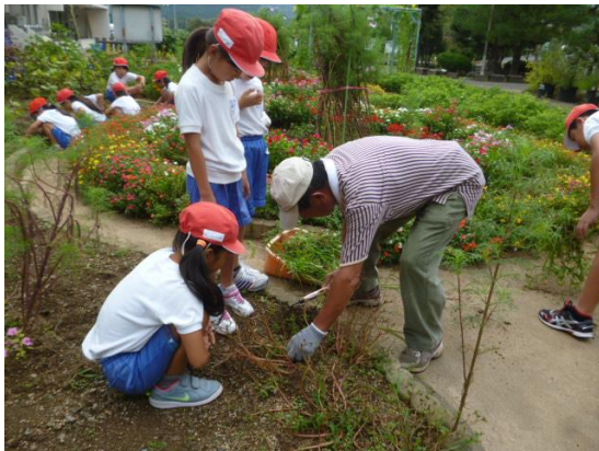
【世代間交流除草作業】