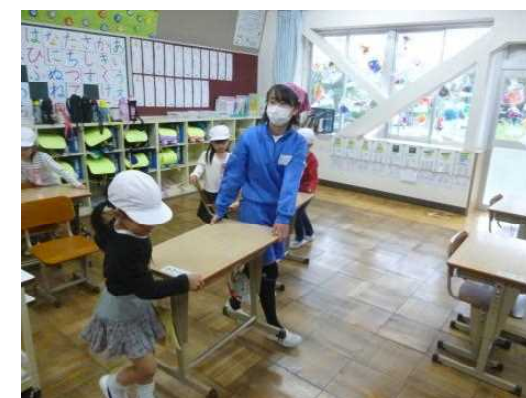
【1年生のところに「掃除のお手伝い」に行っています!】