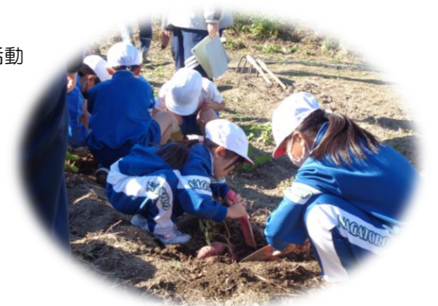
【力を合わせてサツマイモ掘り】