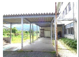
アルミ缶回収ボックス 紙類は通路に置いてください