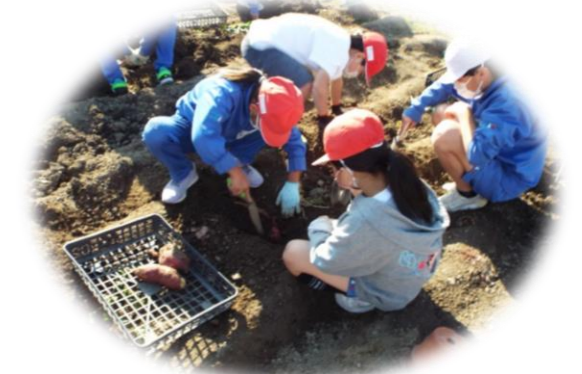
【サツマイモ掘りの様子】