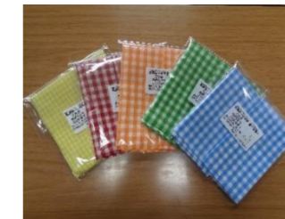
【給食用ランチョンマット】